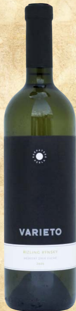
KP Varieto Rizling Rýnsky