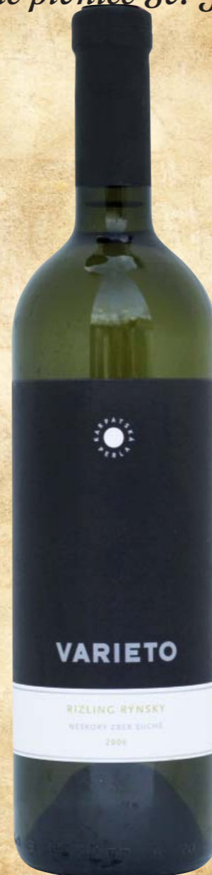
RP Varieto Rizling Rýnsky