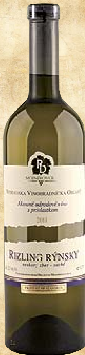
RP Varieto Rizling Rýnsky